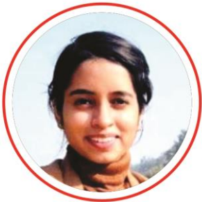
Tanu Singh RRB PO & Clerk 2022

बैंक परीक्षाओ के लिए निश्चित रूप से सर्वश्रेष्ठ मॉक टेस्ट सीरीज