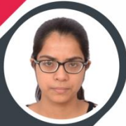
Kriti Advani IBPS PO 2020, Clerk, RRB Clerk

बैंक परीक्षाओं के लिए निश्चित रूप से सर्वश्रेष्ठ टेस्ट सीरीज